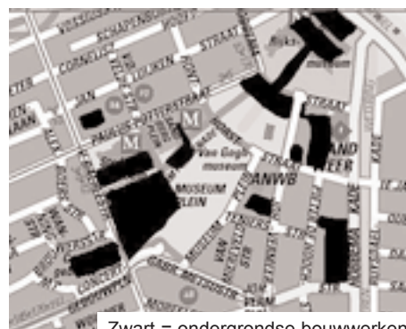
Zwart = ondergrondse bouwwerken

afzijdig houden als het gaat om belangen die zijn gemoed met het handhaven van de grondwaterstand. Er is een Convenant dat bij alle relevante ruimtelijke plannen die waterhuishoudelijke consequenties hebben, de watertoets voorschrijft. De gemeente Amsterdam heeft inmiddels een Grondwaterzorgtaak, zij is niet verantwoordelijk voor het voorkomen en wegnemen van grondwateroverlast, maar spant zich daar wel voor in. Elk plan binnen de gemeente Amsterdam dient aan DWR ter toetsing te worden voorgelegd. Daar wordt o.a. het volgende inrichtingsprincipe gehanteerd: "wijzigingen in de loop en de hoedanigheid van grondwater, evenals wijzigingen in de grondwaterstand, mogen geen hinder voor anderen veroorzaken". Verder geldt natuurlijk dat "een eigenaar van een erf niet in een mate of wijze die volgens artikel 162 van boek 6 (BW) onrechtmatig is, aan eigenaars van andere erven hinder mag toebrengen door wijziging te brengen in de loop, hoeveelheid of hoedanigheid van over zijn erf stro-