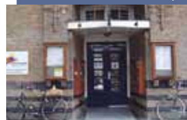
J.M. Coenenstraat 4