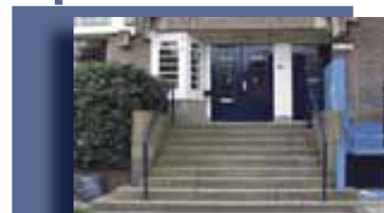
Roelof Hartplein 2a