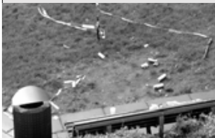
Met linten afgezet stukje grasperk na nachtelijk 'hang' bezoek (november 2009)