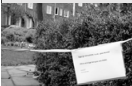
Dag later bij alle vier ingangen linten plus tekst: 'Tijdelijk GESLOTEN i.v.m. grasherstel alleen zò krijgt het gras een KANS'