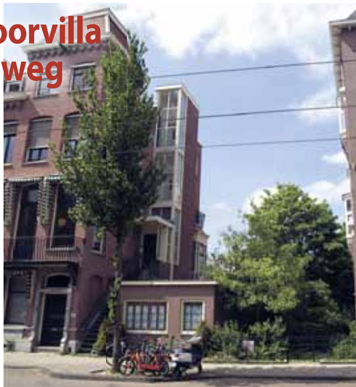
De huidige situatie

Het principe dat het stadsdeel niet zo- maar met bestem- mingsplannen kan sjoemelen en zich in de luren kan la- ten leggen bij het verlenen van een bouwvergunning. Emotioneel zijn wij gehecht aan de ruimtelijke en groe- ne authenticiteit van dit gedeelte van het in 1905 ge- bouwde stuk van de Koninginneweg. Een bouwvergunning voor het makelaarskantoor zou een vrijbrief zijn voor volgende bebouwing van stadstuinen tussen de woonblok- ken van deze mooie straat en een einde maken aan het groen, het licht en het doorzicht." Richting Amstelveenseweg is dat pre- cedent er al. Daar is de oorspronkelijke ruimte tussen twee woonblokken inge- vuld door een kantoorgebouw (nr.184). Er zijn ook praktische bezwaren. Julius