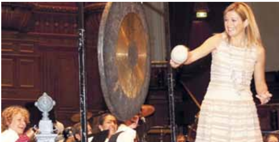
H.K.H. Prinses Máxima opende de dag met een gongslag op het podium van de Grote Zaal

Prinses Máxima opende de tweede editie van Het Concertgebouw Open met een gongslag in de grote zaal. Tijdens Het Concertgebouw Open waren op het Stadspodium in de Grote Zaal, maar ook in de Kleine Zaal, de Spiegelzaal en diverse foyers, doorlopend optredens van honderden talentvolle Amsterdamse amateur-musici. Uit meer dan 120 aanmeldingen waren zo'n 50 acts uit alle delen van de stad geselecteerd. Samen zorgden ze voor een gevarieerde muzikale afspiegeling van Amsterdam. Het Concertgebouw Open trok ruim 5000 bezoekers.