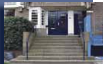
Roelof Hartplein 2a