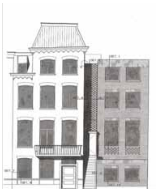
De kantoorvilla vanaf de Koninginneweg...