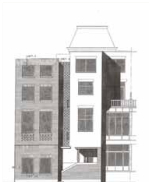
...en gezien door de bewoners van de Sophialaan