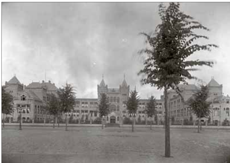
De Valeriuskliniek zo'n 100 jaar geleden (archief foto)

Eind jaren 80 kwam de wet op de geneeskundige behandelingsovereenkomst. Daarin is vastgelegd dat de hulpverlener de cliënt moet informeren over zijn ziekte of verschillende behandelmethodes zodat de cliënt zelf kan kiezen."