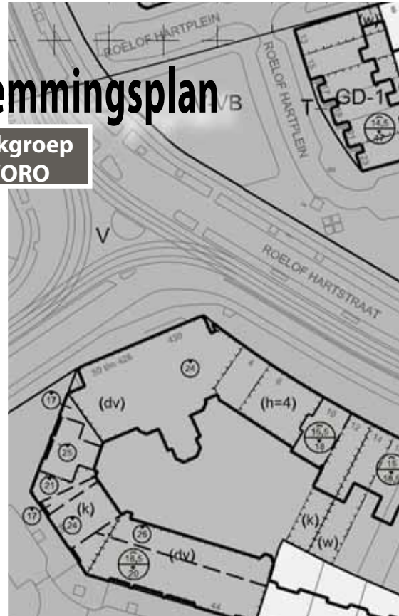
Plankaart: detail Roelof Hartplein

Lees op pagina 10 de informatie van het stadsdeel over het ontwerp bestemmingsplan