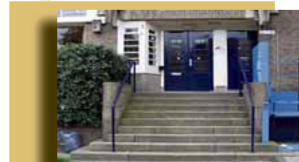
Roelof Hartplein 2a