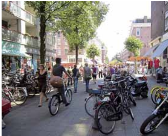
Fietsparkeren bij de Albert Cuypmarkt

meer gedwongen tegen het verkeer in te fietsen als ze naar school gaan, en kunnen ze maar moeilijk de juiste rijbaan bereiken als ze na school richting De Pijp rijden. Vroeger bestonden deze problemen niet omdat er een fietsdoorsteek was tegenover de mond van de Pieter de Hoochstraat. Die doorsteek verdween toen de tramhalte vernieuwd en verlengd werd. Het probleem dat daardoor ontstond, werd door niemand ontkend, maar het opnieuw aanleggen van de doorsteek werd door het stadsdeel lange tijd voor onmogelijk en onwenselijk (want gevaarlijk) gehouden. Omdat andere oplossingen ook niet mogelijk zijn, is men nu van plan toch de doorsteek terug te brengen. En het lijkt er nu echt van te gaan komen.