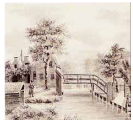
Mennonietensloot omstreeks 1817 (H.Scholten)

Henriëtte Weilers beschrijft niet alleen de onteigening van de bedrijfjes van de allerlaatste bewoners van het Mennonieten Eijland. Maar ook het leven, eten en de kleding tussen de polderslootjes en hoeveel dat wel niet kostte.