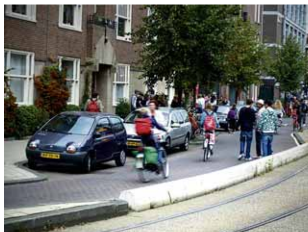
...gedwongen tegen het verkeer in fietsen...

Volgens de laatste berichten wordt er binnenkort eindelijk iets gedaan aan de onveilige situatie in de Ruysdaelstraat ter hoogte van de Pieter de Hoochstraat. Daar worden de leerlingen van het Amsterdams Montessori Lyceum min of