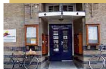
J.M. Coenenstraat 4