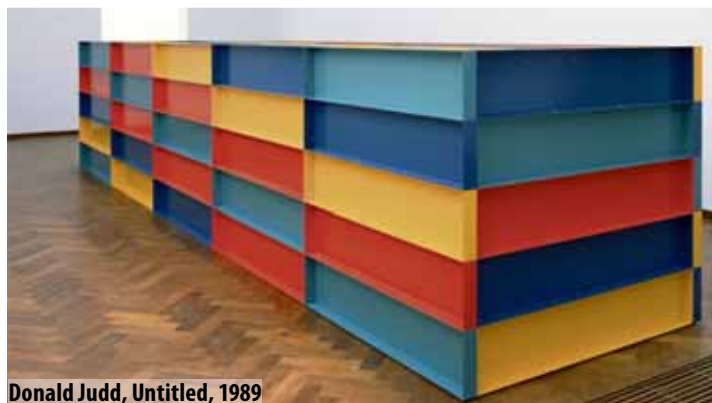
Donald Judd, Untitled , 1989