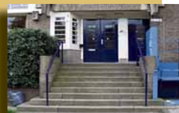
Roelof Hartplein 2a