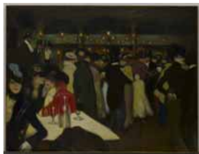
Picoright Amsterdam 2011

Publieksinformatie: T +31 (0)20 5705200 of e-mail: info@vangoghmuseum.nl