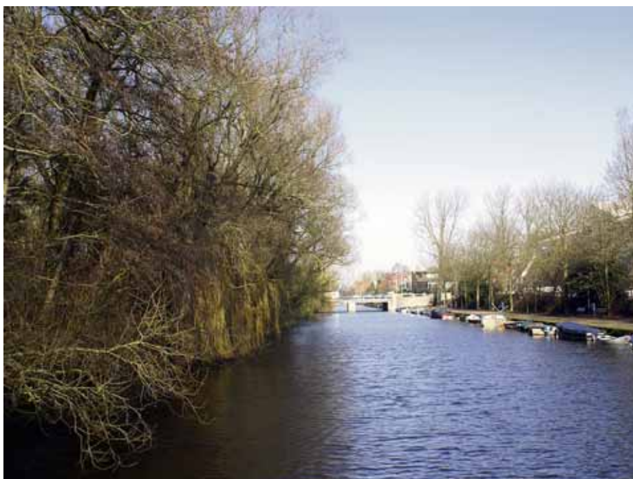
Overtoom, met rechts de achterkant van de RAI