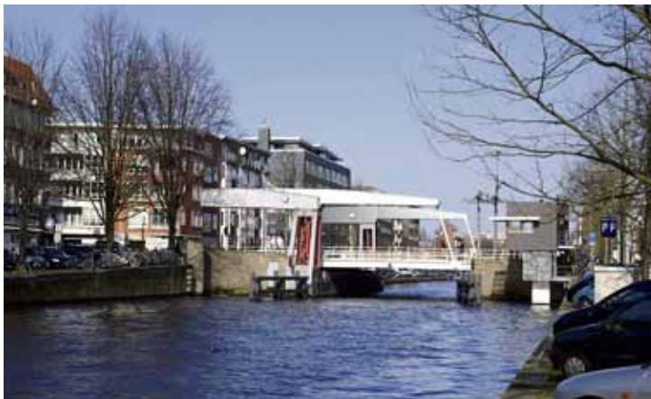
Schinkel met ophaalbrug

Dan hebben we als uitzonderingen op alle regels nog de verschillende Burgwalen. En als bijzondere wateren hebben we een wetering (de Boerenwetering) en zelfs een sloot (de Kromboomssloot).