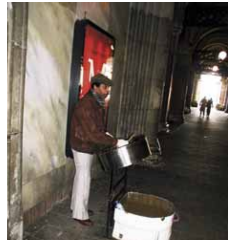
Deze muzikant keert – als het aan het stadsdeelbestuur ligt – sowieso niet terug in de onderdoorgang. En dat terwijl die onderdoorgang zo mooi wordt en de akoestiek nog steeds ideaal is voor een steeldrum.

Iedereen die beseft dat een steeds compacter Amsterdam alleen leefbaar kan blijven als een duurzaam soort mobiliteit met weinig ruimtebeslag (lopen en fietsen) gegarandeerd wordt, begrijpt dat je van die onvervangbare fietsroute af moet blijven. En iedereen die beseft dat het Rijks pas tevreden is als de onderdoorgang is omgetoverd tot een royale foyer, zal ook begrijpen dat na het weren