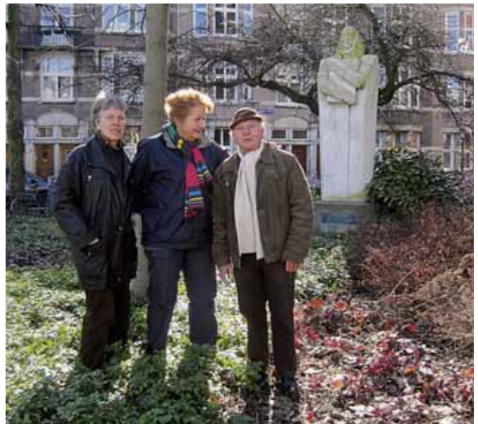
"Met drie burens onderhoud ik nu het plantsoentje rondom Descartes."

verwaarloosd uit. Ik heb toen handtekeningen verzameld voor een voorstel om het plein een beetje op te fleuren. Met als resultaat dat vorig jaar het gras rondom de speeltoestellen, dat toch niet groeide door de schaduw en vele kindervoetstappen, is vervangen door leem en er een paar plantenbakken zijn geplaatst met bloeiende planten. Die plantenbakken gaan wij met een groepje bewoners onderhouden.