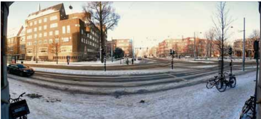
Fraaie foto van het Roelof Hartplein in de winter