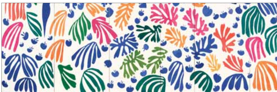
Matisse - La Peruche (detail)

actuele schilder- kunst (van Luc Tuymans, Wilhelm Sasnal, Paulina Ołowska, René Daniëls en Daan van Golden) en recente aanwinsten (in vele soorten en maten).