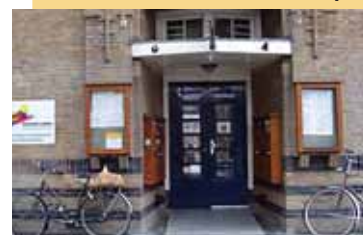
J.M. Coenenstraat 4