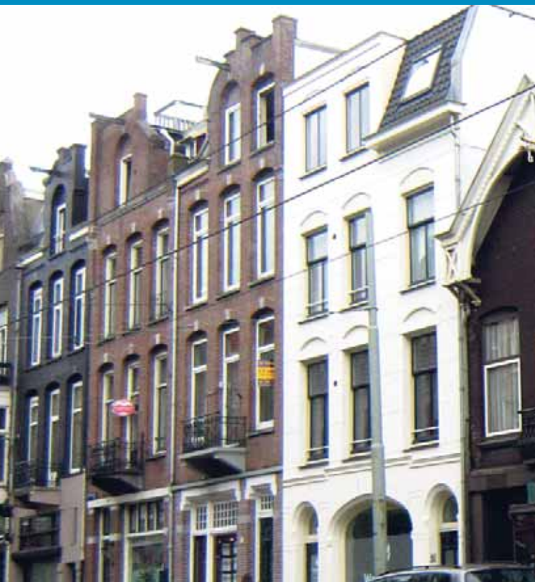
Buurtwinkels – p. 12/3