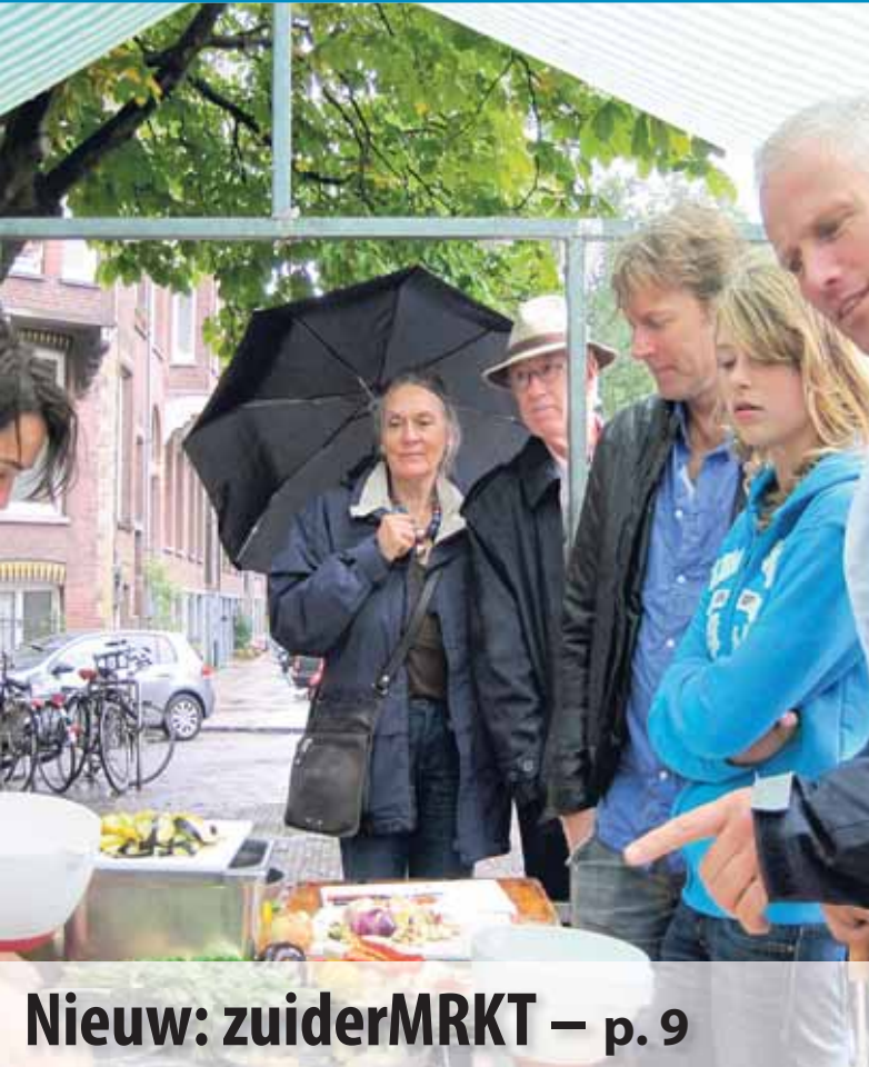
Nieuw: zuiderMRKT – p. 9