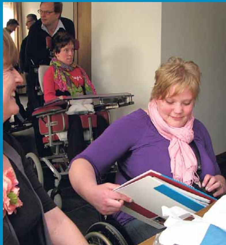
Zorgen voor elkaar - p. 17-9