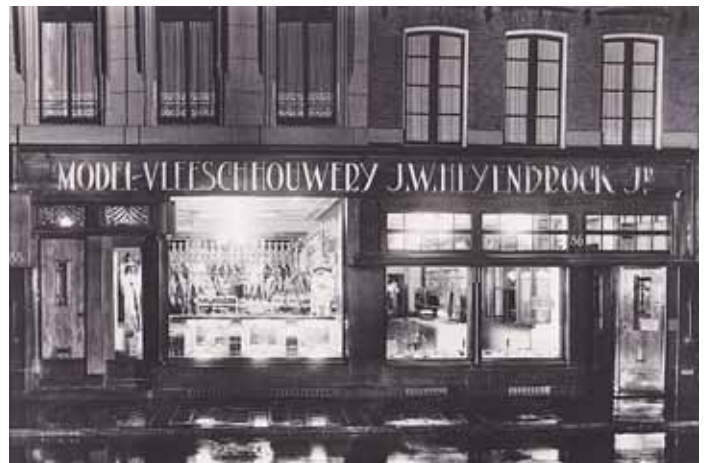
Slagerij Heyenbrock op een regenachtige dag in 1926. In 1965 werd nummer 86 verbouwd tot sandwichshop, maar verder was er tot de sluiting in 1983 niet veel veranderd aan het 19de eeuwse interieur.

Er waren verder twee slaggers: Van der Vaart en Heyenbrock. Van de laatste is het fraaie 19de eeuwse interieur bij de sluiting in 1983 in de con-