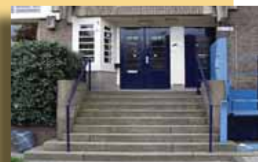
Roelof Hartplein 2a