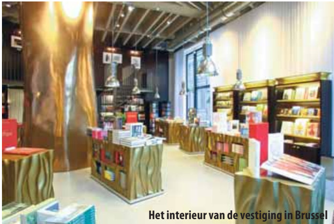
TASCHEN Brussel

De winkel in de PC Hooftstraat valt onder de verantwoordelijkheid van TASCHEN Duitsland. Importeur Librero wordt geen partner in de zaak, al is het bedrijf daar wel voor gevraagd. "Dat doen we niet, we willen niet onze klanten in Amsterdam concurreren. Wij gaan gewoon door als importeur", aldus Peeters in Boekblad. (DH)