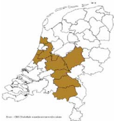
Bruin zijn de 10 schaarstegebieden

Tijdens een debat in de Tweede Kamer op 16 juni bleken CDA, VVD en PVV het plan van minister Donner te steunen. De oppositiepartijen uitten flinke kritiek. Deze kwam overeen met de kritiek van huurdersorganisaties als de Huurdersvereniging Amsterdam en de Nederlandse Woonbond. Het voorstel leidt tot torenhoge huren in schaarstegebieden en de doorstroming c.q. het aantal huurwoningen dat vrijkomt, zal tot een absoluut dieptepunt dalen.