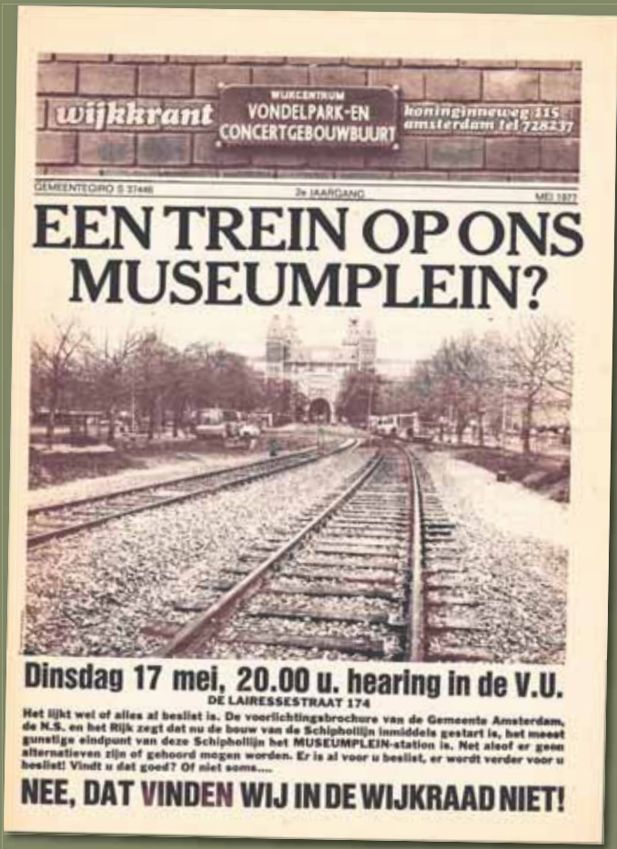
Jaargang 2 – mei 1977