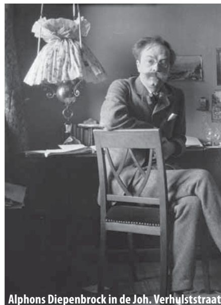
Alphons Diepenbrock in de Joh. Verhulststraat

Alphons Diepenbrocks 'Missa in die festo' wordt op 25 februari 2012 om 14.15 uur uitgevoerd door het Radio Filharmonisch Orkest en het Groot Omroepmannenkoor. Het concert wordt op radio 4 uitgezonden in het kader van de NTR Zaterdagmatinee.