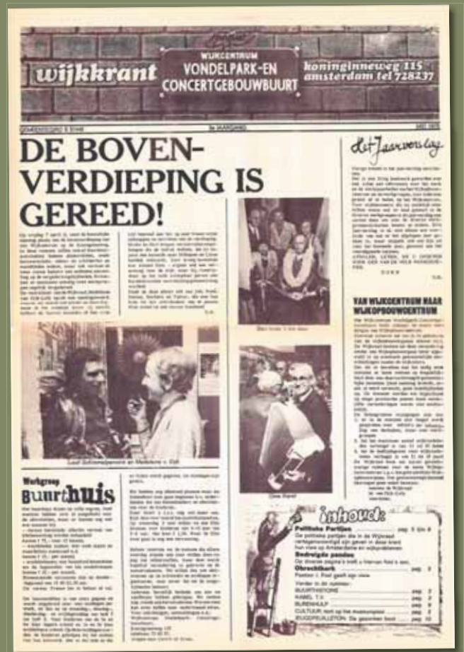
Jaargang 3 – mei 1978