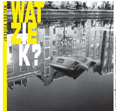
Prinsengracht 1951