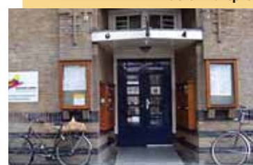
J.M. Coenenstraat 4