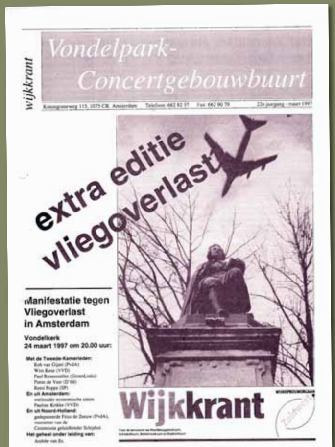
Jaargang 22,3 – maart 1997