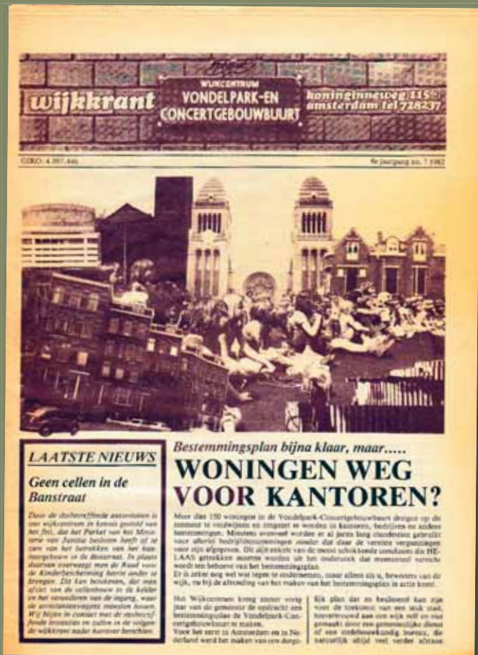
Jaargang 6, 7 – 1982

in de krant minder kruidig. De inhoud straalt een zekere rust, om niet te zeggen saaigheid uit, vergeleken met het roerige begin. Het buurthuis krijgt eind 1980 zijn eigen plek in Huize Lydia. De opening wordt met de steunkleur rood gevierd. In de annonces vraagt Radio Roulette om oude grammofonplaten voor de ziekenhuisomroep en er wordt verzocht: 'Stop de neutronenbom'. De glasbak doet zijn intrede en de (ex)toilethuisjes op het Valeriusplein zijn voorgedragen voor de monumentenlijst.