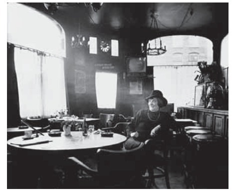
... het café van de Vijftigers

in de krant minder kruidig. De inhoud straalt een zekere rust, om niet te zeggen saaigheid uit, vergeleken met het roerige begin. Het buurthuis krijgt eind 1980 zijn eigen plek in Huize Lydia. De opening wordt met de steunkleur rood gevierd. In de annonces vraagt Radio Roulette om oude grammofonplaten voor de ziekenhuisomroep en er wordt verzocht: 'Stop de neutronenbom'. De glasbak doet zijn intrede en de (ex)toilethuisjes op het Valeriusplein zijn voorgedragen voor de monumentenlijst.