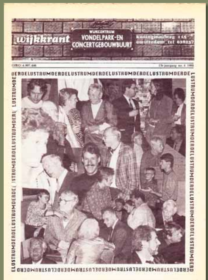
Jaargang 13, 4 – 1988