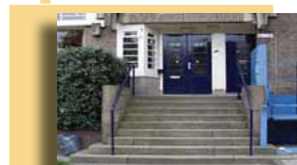
Roelof Hartplein 2a