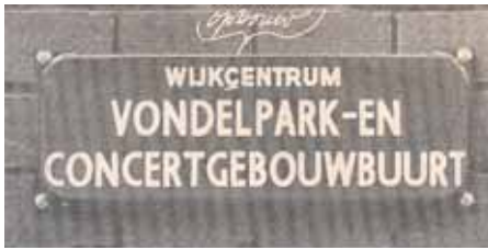
...een nogal knullige accolade

vermelding 'Wijkcentrum' in het blad- logo wordt rond die tijd met een nogal knullige accolade veranderd in 'Wijkop- bouwcentrum'. Reden: het wijkcentrum moest – om voor subsidie in aanmerking te komen – een wijkopbouworgaan wor- den. Maar "de Wijkraad koos – met goed- vinden van de subsidiegever – om zuiver gevoelmatige redenen voor de naam Wijkopbouwcentrum". Hoewel de naam intussen ook het woordje "en" verloren had, is het logo op dat punt nooit aange- past. Wel verdwijnt het in 1996 helemaal van de voorpagina.