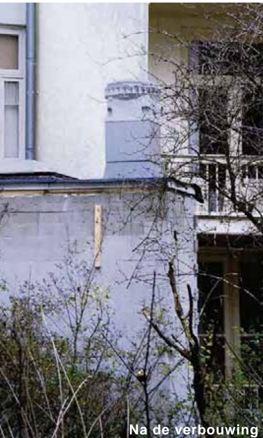
Na de verbouwing

Wij, omwonenden, hebben een bezwaarschrift ingediend. Uit de antwoorden is gebleken hoe weinig men rekening houdt met de bewoners. Eén van de zwaarstwegende argumenten van de bewoners van de hoek Willemsparkweg/Cornelis Schuytstraat was de enorme inbreuk op de privacy in de omliggende tuinen door de voorgenomen uitbouw. In het verweer zegt het stadsdeel 'geen onderzoek naar inbreuk op privacy in de tuinen te hebben gedaan want dit was niet relevant!' Wie zijn onze vertegenwoordigers hier? En wat voor buurt heeft het stadsdeel nu voor ogen?