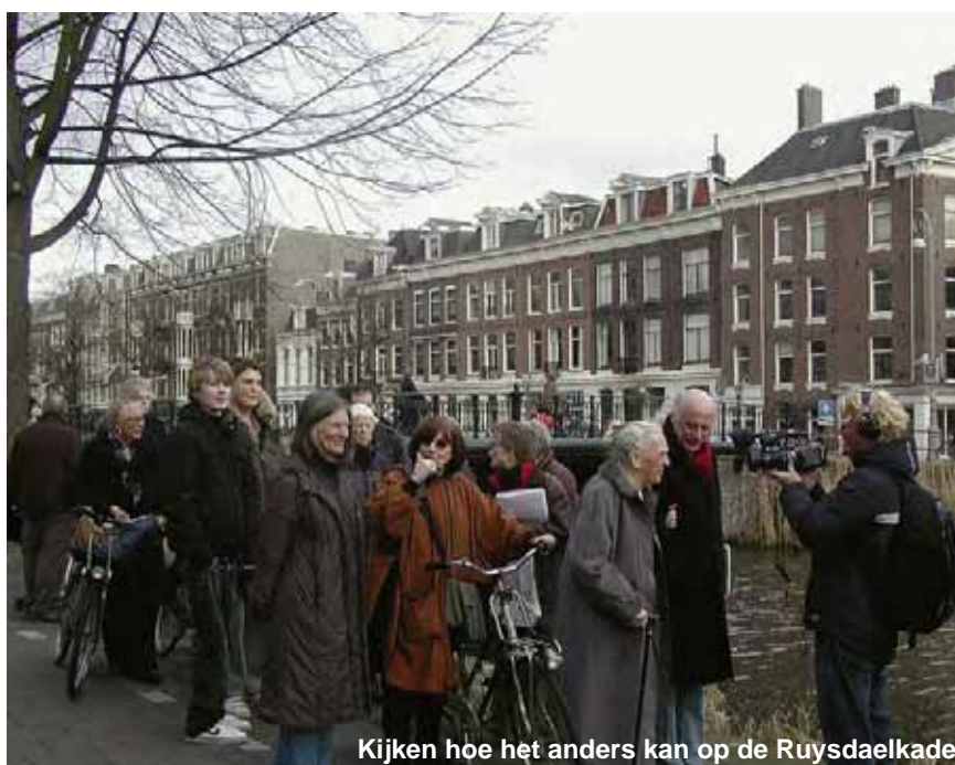
Kijken hoe het anders kan op de Ruysdaelkade

Tijdens een plenaire bespreking achteraf in het Fons Vitae liep de verontwaardiging hoog op toen geïnventariseerd werd hoe dikwijls de Dienst Binnenwaterbeheer al met klachten is bestookt – grotendeels zonder gevolg. De beide vertegenwoordigers van het stadsdeelbestuur lieten weten dat nieuw beleid in de maak was om te komen tot duidelijkheid aangaande de plekken waar wel en niet afgemeerd mag worden. Zolang dat beleid niet is geformuleerd kan