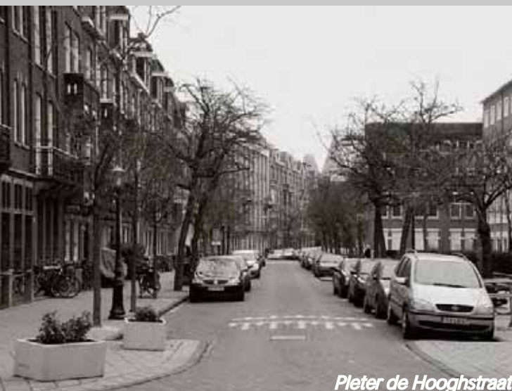
Pleter de Hooghstraat