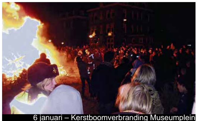
6 januari – Kerstboomverbranding Museumplein